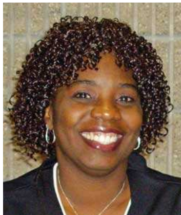
Par Ellyn Jo Waller

J'ai grandi dans la ville de New York. Dans mon adolescence j'ai remarqué des femmes légèrement vêtues dans les rues de Manhattan, évidemment en train de chercher des « clients ».