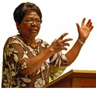
Par Dorothy Selebano Présidente du Département des Femmes de l'ABM